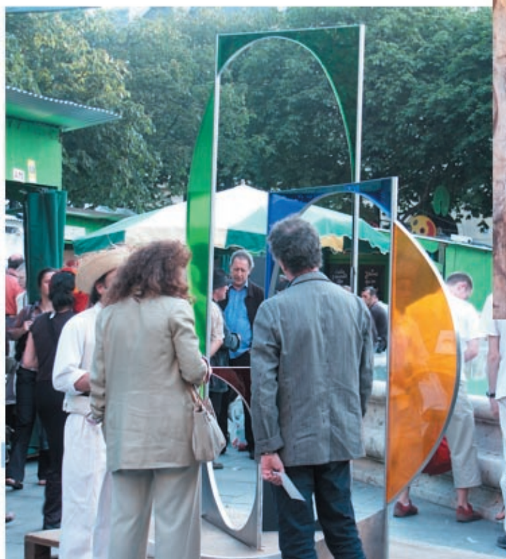
PARTICIPATION DU PUBLIC LE 6 JUIN 2005